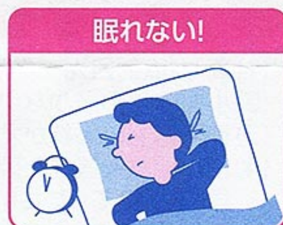
体が暖まるとかゆい!