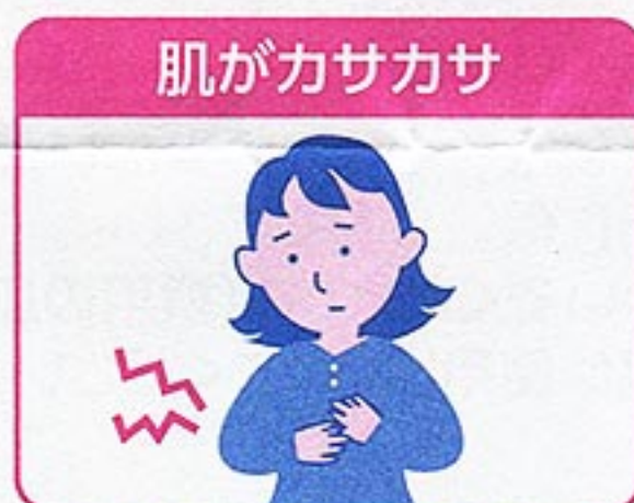
成人のカサつく肌に