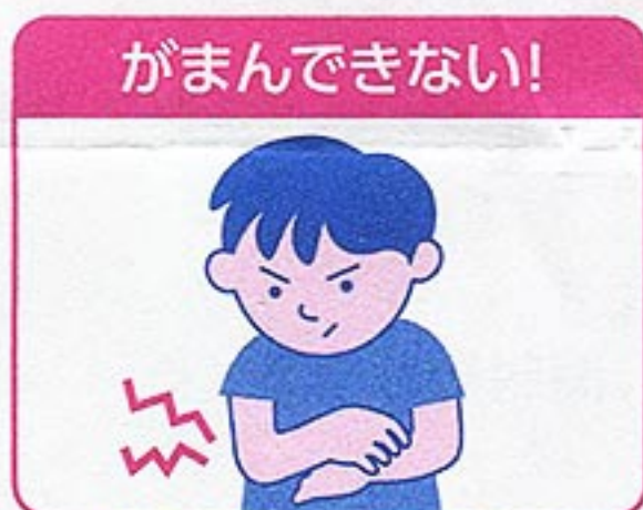
小児のカサつく肌に