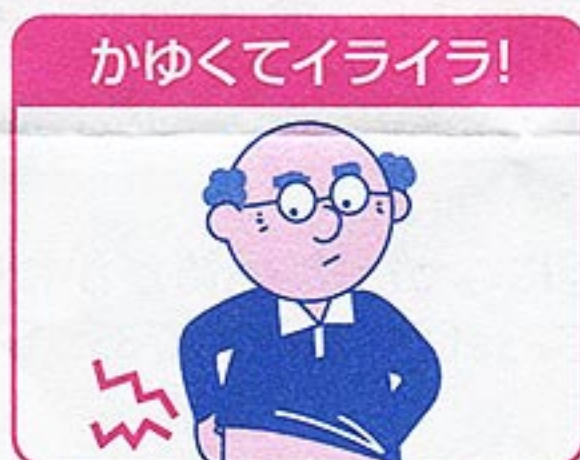
老人のカサつく肌に