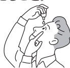
容器の先が目、まぶた、まつ毛にふれないように